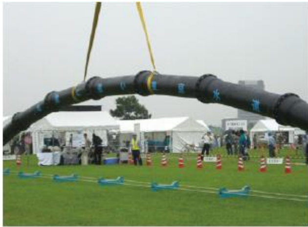
▲耐震継手管のつり下げのデモンストレーション

既に配水管の大部分は、十分な耐震強度を有していますが、阪神・淡路大震災では、継手部分で外れて断水が多く発生しました。その教訓から、耐震継手管への取替を進めており、今後も、効果的に断水被害を軽減するため、重要施設への供給ルートなどの耐震継手化を優先的に推進していきます。